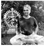
EKARSHI SARVA ATMA MITHRA